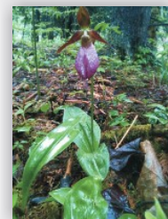
sabot de la vierge 14 ans pour faire une fleur! SVP ne pas arracher

Si vous faites le sentier en raquettes l'hiver, utilisez vos bâtons de ski de fond.