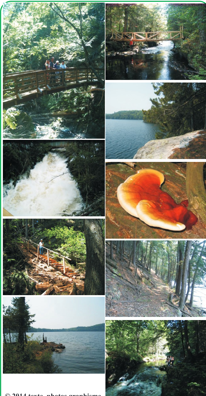
© 2014 texte, photos graphisme Richard Chartrand